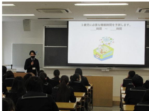
【大曾基宣先生:「子どもの睡眠」】