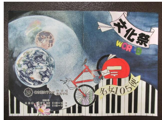
【今年度パンフレット】