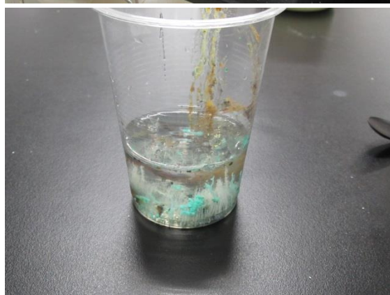
【自然科学部の活動風景】