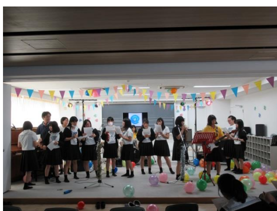
【前日の準備風景: 中部部・花道部・軽音楽部】