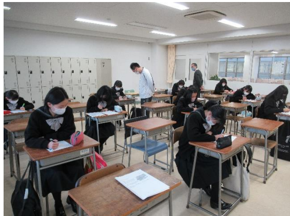
【 \infty 講座：数学「一筆書きと数学」】