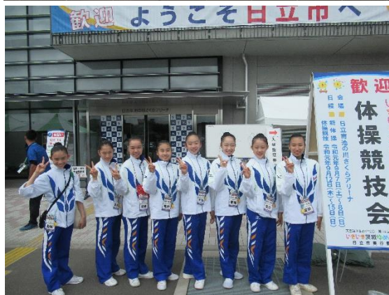
【茨城国体出場選手】