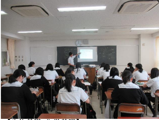
【生物基礎・化学基礎】