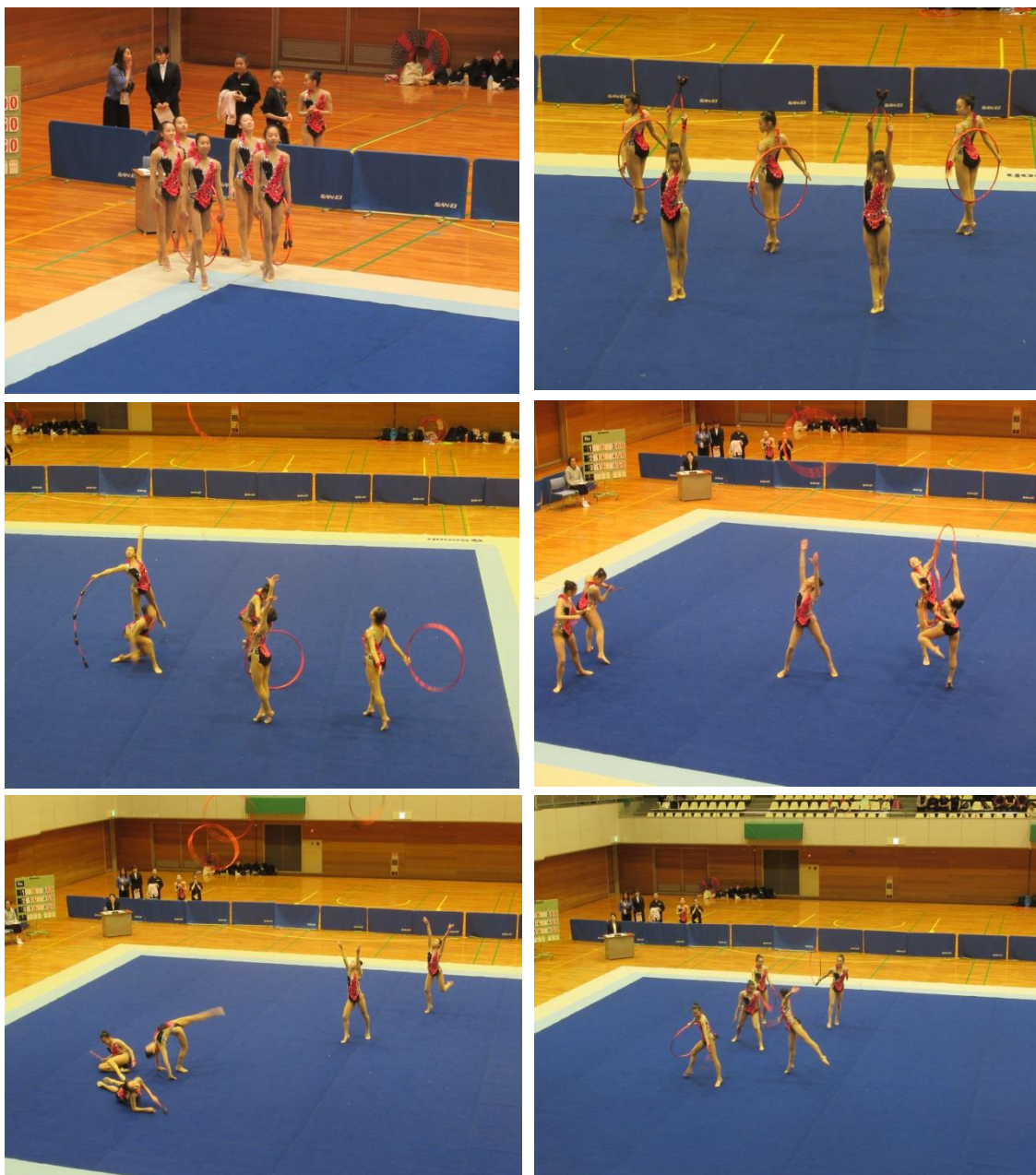
【団体競技①: 得点 21.800】

令和元年6月9日(日)、愛知県新体操選手権大会少年女子1部が日本ガイシスポーツプラザで行われました。団体競技、個人競技(4種目)の合計点で争う少年女子1部で、本校新体操部はすべてに最高点を出し、圧倒的な力で優勝を果たしました。この大会は国民体育大会予選を兼ねており、優勝した本校は愛知県代表として国体東海大会に出場し、国民体育大会本選を目指します。遅い時間まで、多くのご声援をありがとうございました。(校長)