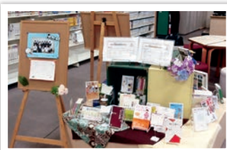
平成27年6月放送部展示