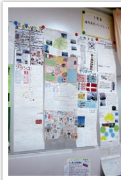
一貫1年 海外旅行パンフレット