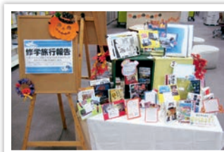
平成27年8月 修学旅行報告展示

前期は6月に放送部が展示をしてくれました。活動紹介と手づくりのPOPも添えて活動にかかわる本の展示をし、好評を博しました。