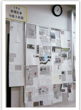
一貫3年 新聞記事切り抜き新聞