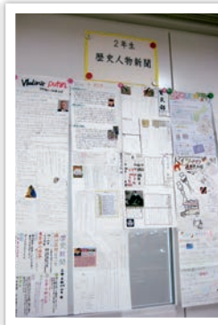
一貫2年 歴史人物新聞