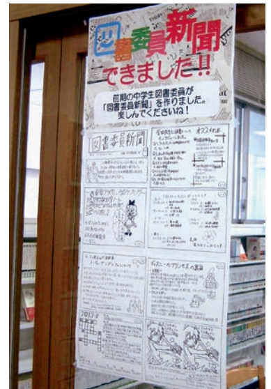
図書館入口のガラス、閲覧室のガラスに掲示しています。ぜひ見てください。

平成27年度前期の図書委員（一貫1～3年生）が記事のアイデアを出すところから始め、調べものをしたり、先生方へ取材に行ったりして、一枚の新聞を作り上げました。「人気の本ランキング」あり、「先生のおすすめ本インタビュー」あり、「クロスワード」や「間違い探し」といったお楽しみコーナーありと、とてもにぎやかな新聞となりました。