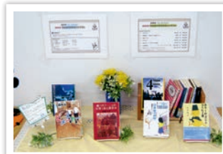
文化祭放送部展示