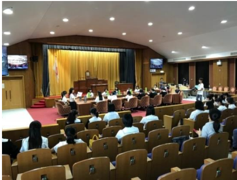
【参議院国会体感プログラム】

体感プログラムでは裁判員裁判の法案提出についての議論を繰り広げ、役割に沿って議員の仕事を体感しました。その後はTEPIA 先端技術館へ移動し、日本の技術力の高さを体感し、またドローン等の操縦を通してプログラミングについて学びました。