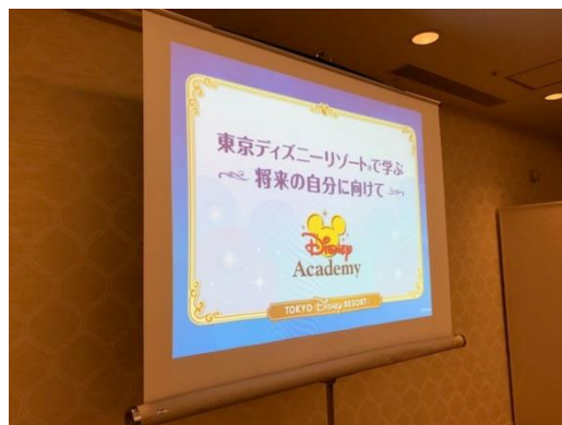
【ディズニーアカデミープログラム】

ディズニーアカデミー主催の「将来の自分に向けて」の研修を受けました。ディズニーリゾートを「遊ぶ場所」ではなく「働く」という視点で見つめ、パーク内には様々な仕事があり、その仕事1つ1つに大切な意味があり、また責任があり、常に相手の立場に立ち、思いやりを持って接することの大切さを学びました。午後から訪れたディズニーランドでは、キャスト目線でパーク内を見ながら過ごすことができました。また訪れたいと思える理由が分かったという生徒もいました。短い時間ではありましたが、働くことを通して将来の自分の姿を想像する時間を持ち、今から自分の将来に向けて何ができるのかについて考えるなど、大変貴重で有意義な経験をすることができました。