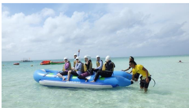
【ハテの浜のきれいな海】