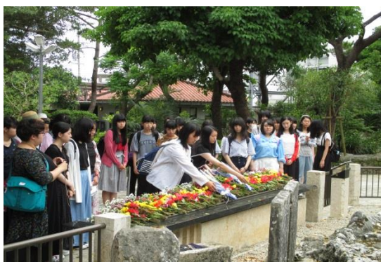
【ひめゆりの塔にて献花】

肌で感じた沖縄の歴史や文化、人々の温かさ、豊かな自然、友人たちと過ごした時間、これらの全てが生徒たちの今後の糧となることでしょう。